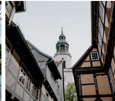
Celler Altstadt ± 20,5 km