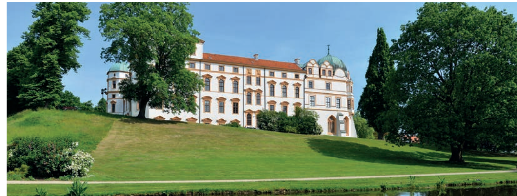
Celler Schloss ± 20,5 km