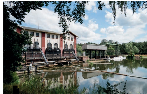
Wasserkraftwerk Oldau ± 6,4 km