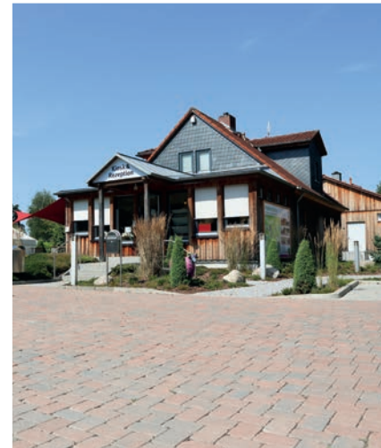
Startpunkt Campingpark Starting Point

the varied river landscape of the Aller glacial valley and follow the Aller cycle path far away from traffic through wooded areas and along the meadows of the Aller. Visit the old town of Celle with its ducal castle. Via the villages of Klein Hehlen and Boye, you cycle over lush green areas, through extensive forests and fields back to Winsen.